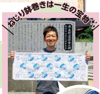
なじり鉢巻きは一生の宝物☆

家族にメッセージを書いてもらった手ぬぐいをずっと頭に巻いて走っていましたが、旅の途中で出会った人たちにもあたたかいメッセージを書いてもらい、最後にはこんな素敵な宝物に!