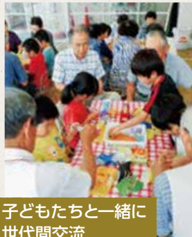
子どもたちと一緒に世代間交流