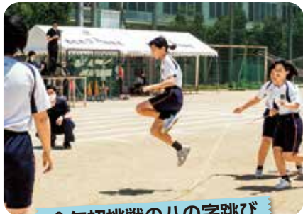
今年初挑戦の八の字跳び