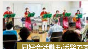
同好会活動も活発です