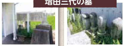
⑥毘沙門堂・増田神社 増田三代の墓