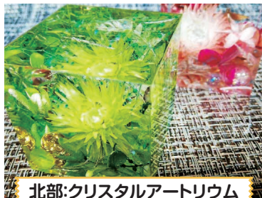
北部:クリスタルアートリウム

木太地区コミュニティセンター3館の後期講座が9月中旬より受付を開始しました。詳しい講座の内容は、木太・木太南・木太北部コミュニティセンター、木太北部会館窓口ほか、木太町ホームページにも掲載しておりますのでご覧ください。