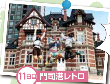
11日目 門司港レトロ