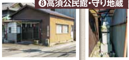
⑧高須公民館・守り地蔵