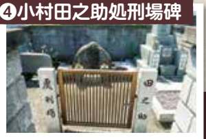
④小村田之助処刑場碑