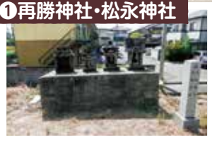
①再勝神社・松永神社