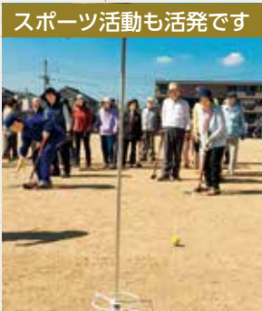
スポーツ活動も活発です