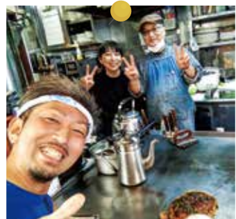
広島で会ったお好み焼き屋のご夫婦と。大好きな浜田省吾さんの話で盛り上がりました!