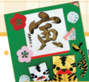
北部:簡単!干支飾り教室