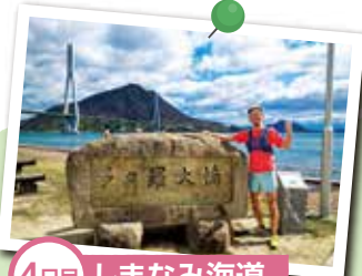
4日目 しまなみ海道