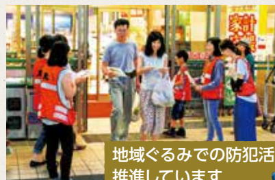
地域ぐるみでの防犯活動を推進しています