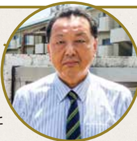
いろいろな講座を企画しています

木太南コミュニティセンターは、老若男女すべてのかたの利用場所であり、今まで一度も利用されていないかたも、気軽に利用できるセンターになるよう、職員一同頑張っておりますので皆さまのご支援ご協力をお願い申し上げます。