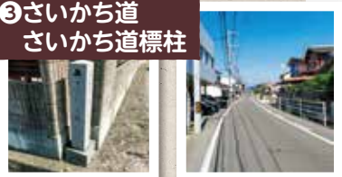
③さいかち道 さいかち道標柱