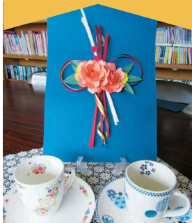
南:ポーセラーツとペーパーデコレーション