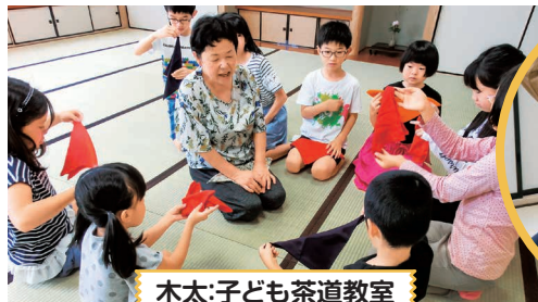
木太:子ども茶道教室