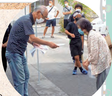
敬老会最高齢者のご紹介

また、敬老会では木太町最高齢者の紹介の一コマも。最後は和太鼓倶楽部による演技と和太鼓体験コーナー。みんな笑顔いっぱい楽しい一日でした。