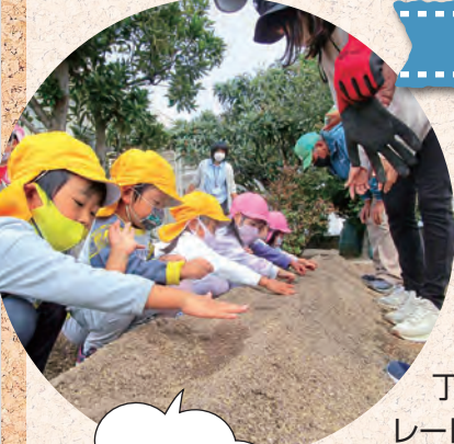
早く大きく育ってね~

木太北部幼稚園では、地域の人たちと一緒に一年間を通じて色々な種類の野菜を育てています。秋の楽しみといえば『サツマイモ掘り』。土の中からたくさんのサツマイモが出てきて歓声があがりました。