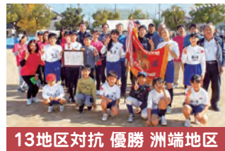
13地区対抗 優勝 洲端地区