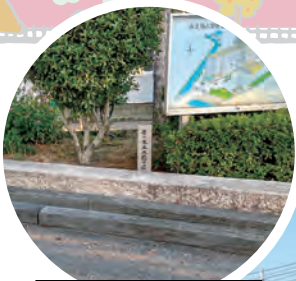
木太南小学校保存石橋の桁

木太大橋は、現在長尾街道(県道高松長尾大内線)の詰田川の東西に架かり、夷地区と札幌地区を繋ぐ大橋ですが、昔は今の橋の南東側に南北に架かる石橋でした。この石橋は、安政二年(1855)に木造の土橋から永代橋として石橋に架け替えられ、この時に通行の安全を祈願して石灯笼も橋の袂に建てられました。