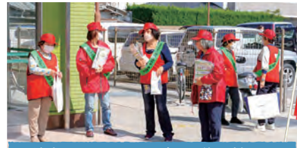
香川県くらしの見守り隊の皆さん