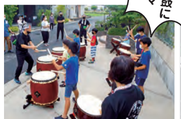
初めての和太鼓にみんな興味津々