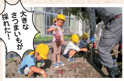
大きなさつまいもが採れた!

掘った後は美味しいお楽しみ♪みんなで丁寧に洗って、蒸かし芋にしたり、ホットプレートでバター焼きにして食べました。甘~い匂いにつられておかわりする子どもたちが続出。楽しくて美味しい思い出がまた1つ増えました。