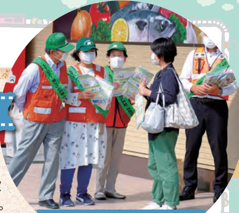
日頃のコミュニケーションがとても大切ですね

今回は、香川くらしの見守り隊(木太地区婦人会)と安全安心町づくり推進協議会との合同で実施され、それぞれのジャンパーを身に着けたメンバーは、利用客を中心に、チラシやポケットティッシュなどが入った啓発グッズを手渡し、被害に遭わないよう訴えました。