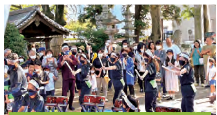
八坂神社の大祭にも奉納しました