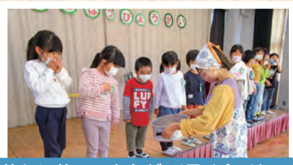
蒸かし芋のできあがり!早く食べたい!