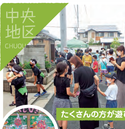
たくさんの方が遊びにきていました