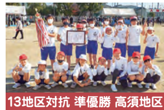
13地区対抗 準優勝 高須地区