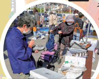
チャリティーバザーも開催しました

それぞれのコミセンでの作品展示もすっかり見慣れた風景となりました。分散開催となった木太地区文化祭ですが、今年もたくさんの方に来場していただきました。10日間という期間限定ではありましたが、木太、木太南、木太北部コミセン、木太北部会館それぞれで活動している同好会の日ごろの活動成果やコミセン講座の作品、地域の方々からの出展でにぎやかな文化祭ができました。最後に事前の準備から運営にお手伝いくださった地域の皆さまにお礼申し上げます。ご協力ありがとうございました。