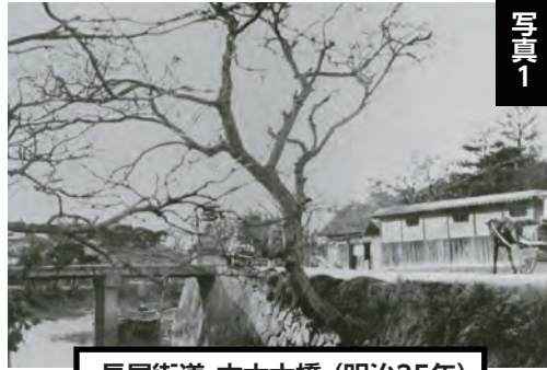
長尾街道・木太大橋 (明治35年)