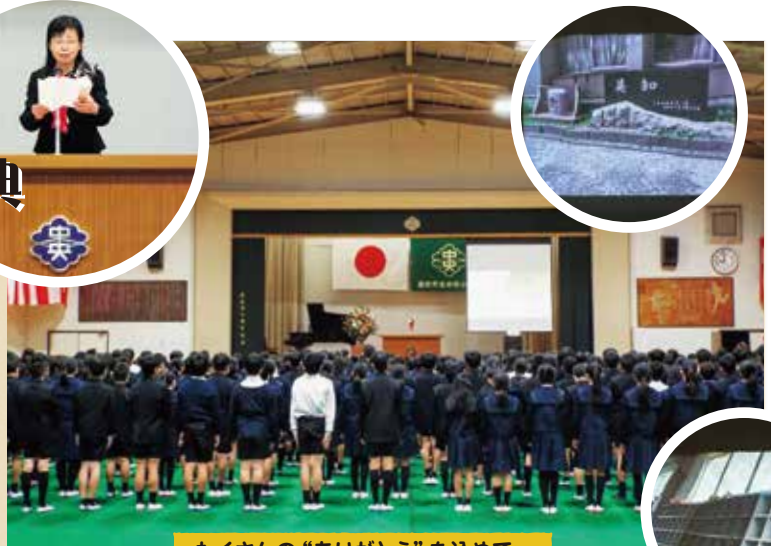
たくさんの“ありがとう”を込めて…

次の60周年に向けて、これまで培ってきた中央っ子の伝統を引き継ぐとともに、新たな時代を創っていかうとする子どもたちの思いを、職員一同大切に育んでいきたいと思います。