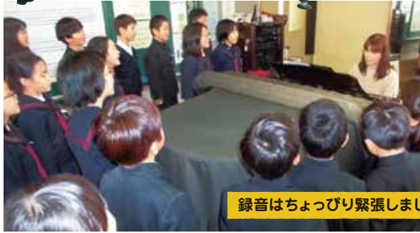
録音はちょっぴり緊張しました

この機会に、経年劣化した音源をリニューアルすることにし、録音しました。合唱部児童の元気な歌声を、地域の皆さまにお届けします。どうぞ、お楽しみにしてください。