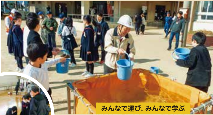
みんなで運び、みんなで学ぶ

本校の6年生は、地域の目標「広げよう、安全安心、地域の輪」を達成するために児童が主体となった防災訓練を計画、実行することとなりました。