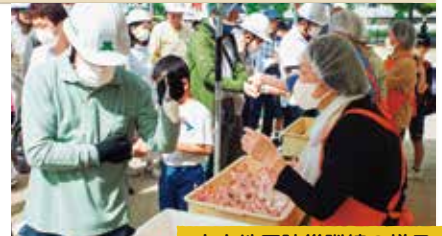
木太地区防災訓練の様子