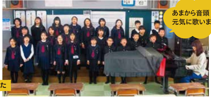
あまから音頭 元気に歌います！