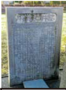
鑿井水神社記念碑