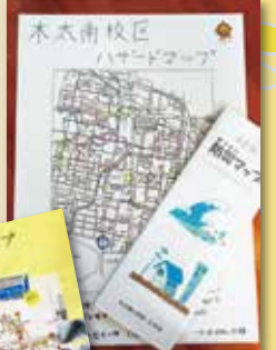
みんなの努力の結晶

当日は非常食、簡易担架づくりなど、8つの内容を発信。参加した地域の方から、「防災について考えるきっかけとなった」との声をいただき、自分たちの取り組みが地域の役に立てたことを実感することができました。